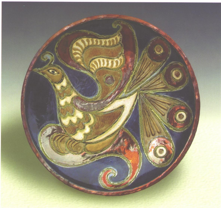
Шарай Г. Г. Нар. 1921 р. Таріль декоративний. 1978 р. МУНДМ