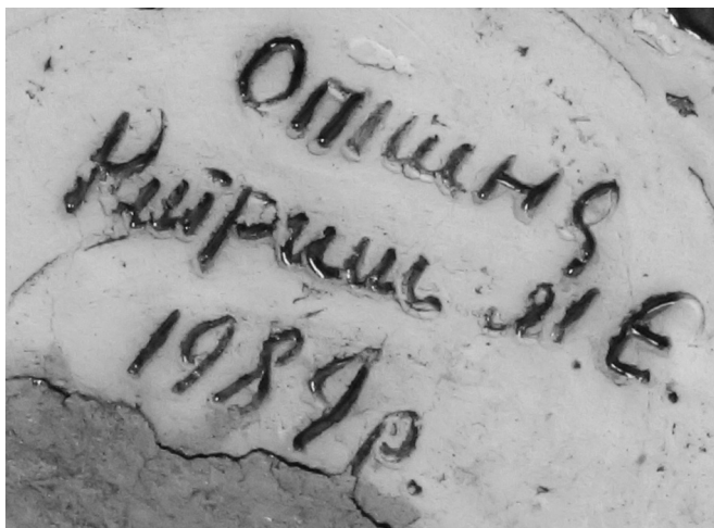
Фото 2–4. Малий епіграфічний напис на виробі Михайла Китриша (фрагмент). Опішня, 2018. Фото Оксани Ликової. Національний музей-заповідник українського гончарства в Опішному, Національний архів українського гончарства.

Прикметно, що більшість робіт підписані автором, що значно спрощує їхню атрибуцію. Ці підписи достатньо різноманітні й можуть слугувати окремим джерелом для епіграфічних та керамологічних досліджень. За твердженням дослідників опішненські гончарі масово почали підписувати кераміку у 1969 році. До цього часу виробу в більшості були безіменними: «нарешті 1969 року опішняни вперше побачили під своїми виробами свої імена. Й збагнули, що Опішня не масовість, не «кінкубаторний» півник, коник чи левик з ім'ям ширпотреб; Опішня – то динаміка й пластика, несподіваність, думка і філософія; Опішня – це унікальне передмістя ще городотівської столиці полян Гелона, своєрідний – од віку до віку, з таїни в таїну, з глибини в глибину!.. – національний голос, що його можна чути, впізнавати, навіть не убачивши, хто говорить; ним можна жити, вчаровуватися, печалитися» 1 , – писав на початку 1990-х років Олексій Дмитренко. Красномовним у цьому плані є вислів одного із найстаріших гончарів Опішного Івана Білика: «Ми були безіменні. Й воно, ото, знаєте, схоже на те, що головний інженер [Трохим Демченко] тримав нас у погребі, а Петро Олександрович [Ганжа] узяв та й ляду відкрив. І вилазьте на світ, каже...» 2 .